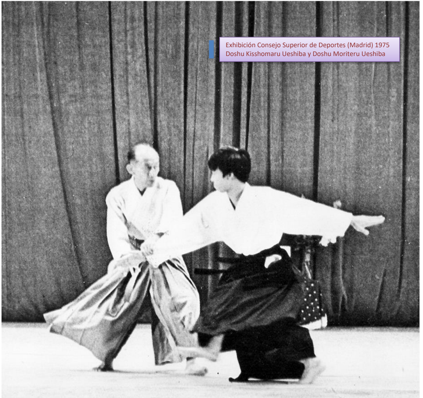
Exhibición Consejo Superior de Deportes (Madrid) 1975 Doshu Kisshomaru Ueshiba y Doshu Moriteru Ueshiba