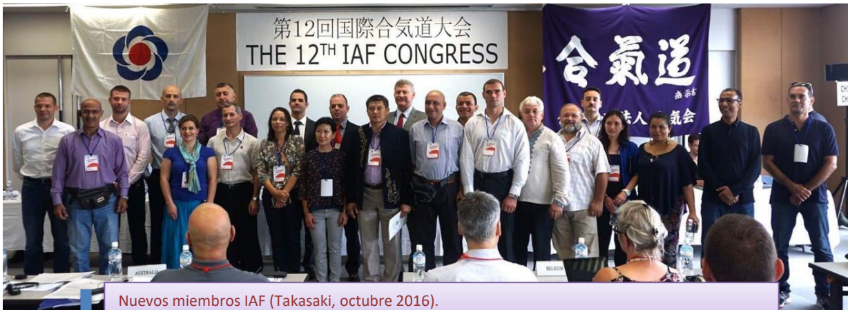
Nuevos miembros IAF (Takasaki, octubre 2016). España, Hungría, Croacia, Marruecos, Kirguistán, Grecia, Egipto, Lituania, Colombia y Ucrania

Uno de los días más importantes para nosotros era el jueves 29 de septiembre, ya que se votaría la admisión de los 10 países que fueron aprobados en el pasado como candidatos. Tras una pequeña presentación de los representantes de cada país candidato a ser miembro de la IAF, los integrantes de la Federación Internacional de Aikido votaban su adhesión. Se realizó el sufragio a puerta cerrada y al finalizar dicha votación, nos invitaron de nuevo a entrar para comunicarnos que todos los candidatos habíamos sido admitidos.