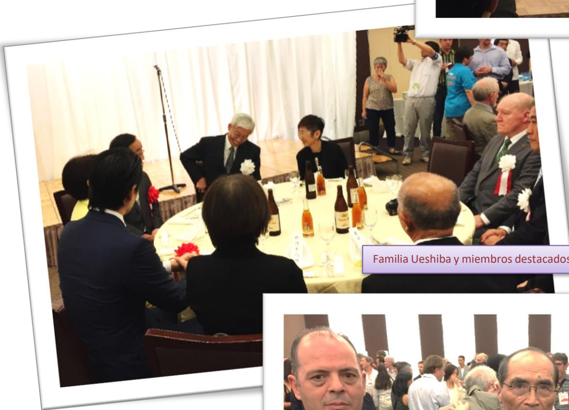
Familia Ueshiba y miembros destacados (mesa presidencial)