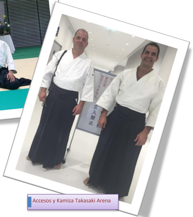
Accesos y Kamiza Takasaki Arena

Me congratula confirmar que nuestra práctica está alineada con la línea de trabajo del Hombu Dojo y lo podéis corroborar con la magistral exhibición que Doshu Moriteru Ueshiba realizó el día de clausura.